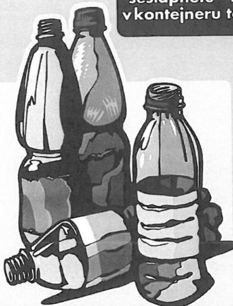
plastové nádoby a láhve, PET láhve (od nápojů)

PET láhve, prosím, sešlápněte - nezaberou v kontejneru tolik místa.