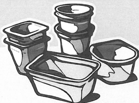
kelímky od jogurtů, krabičky od pokrmových tuků